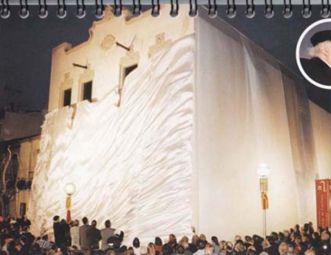
1999 S'inaugura el Museu Municipal Joan Rbello.