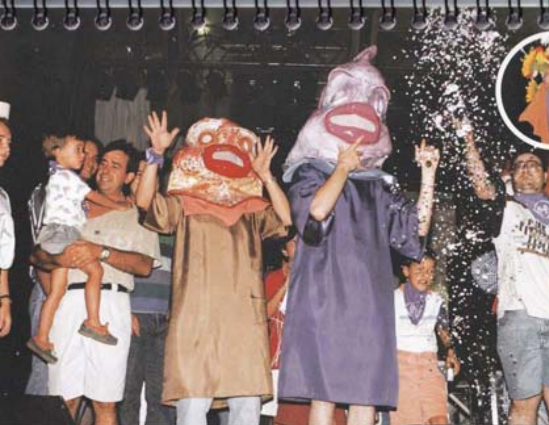
1995 S'estrenen les colles de Morals i Torralles.