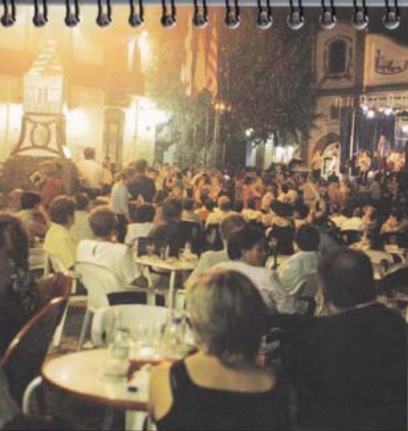
Plaça Pral de la Riba.