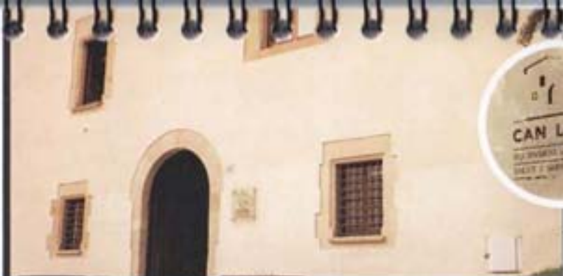
1993 S'inaugura Can Lledó.

M 1993 M 1993 Mollet, mil anys fent país