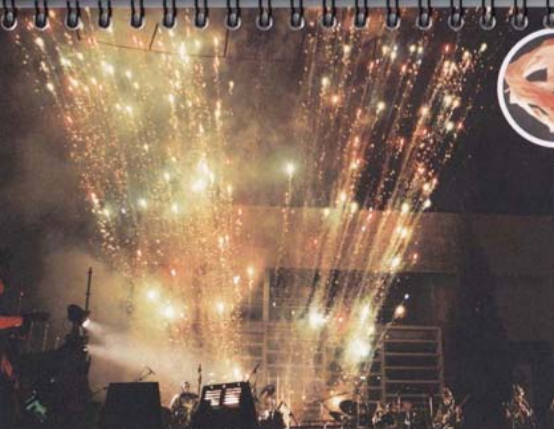
2002 S'inaugura la nova Casa de la Vila.