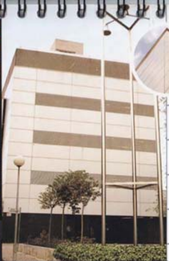
1996 Mollet esdevé ciutat universitària amb l'Escola Universitària Politècnica de Medi Ambient.