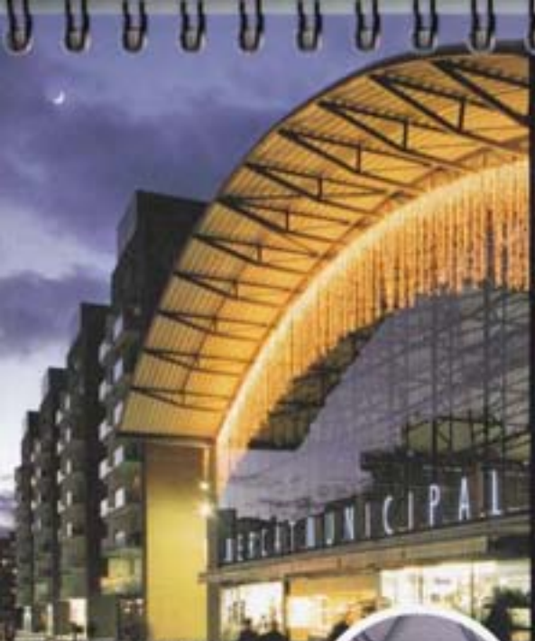
1996 S'inaugura el nou Mercat Municipal.