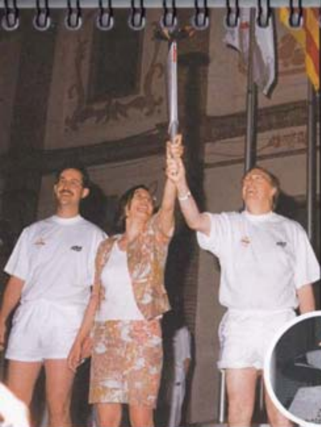
1992 Mollet es Ciutat Pòbilla de la Sardana.