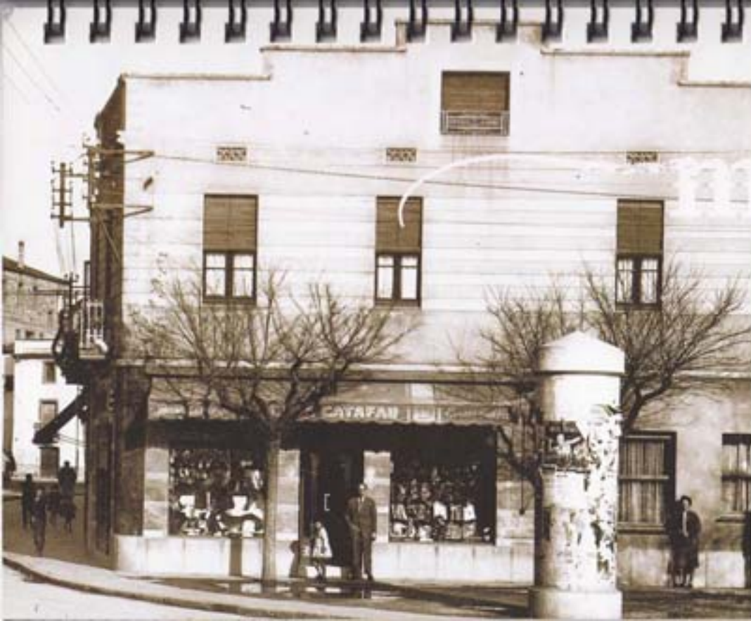
Àngel de cal Catafau, a la plaça de Catalunya