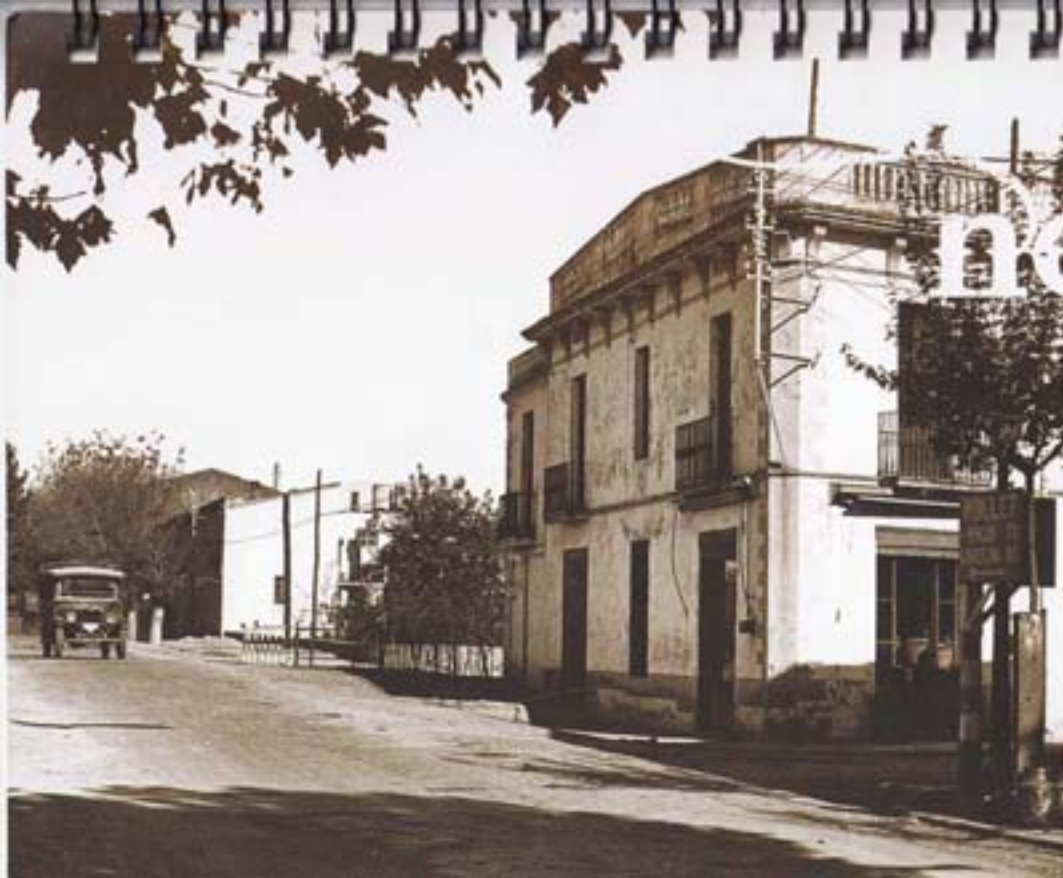
Graneria de cal Mitjà, als Quatre Cantons; a principis del segle XX