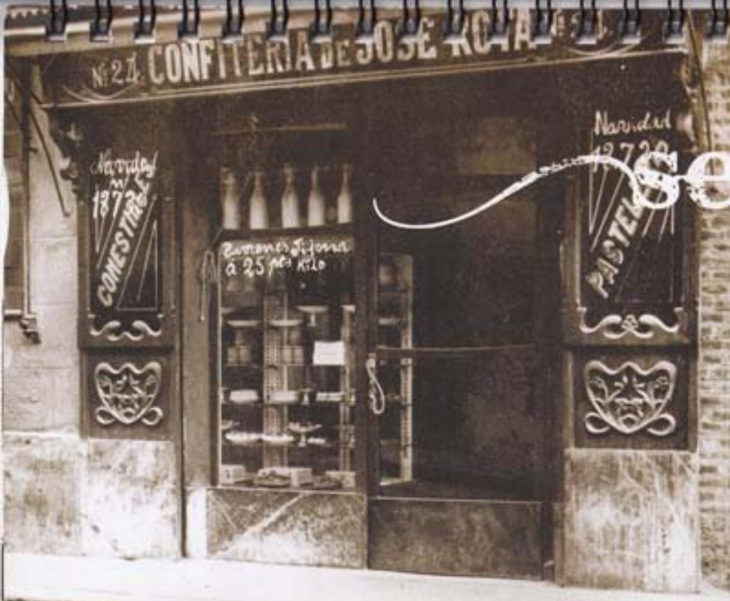
Confiteria Rota, a Gaietà Ventalló, el 1942