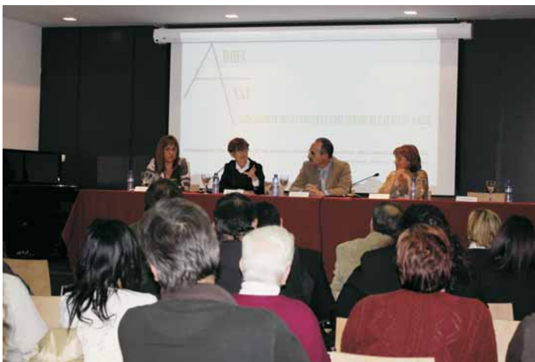
La consellera i l'alcalde, en la cloenda de l'acte

La consellera de Treball, Mar Serna, va visitar Mollet per donar suport a l'Associació de Dones i Homes Emprenedors de Catalunya Segle XXI, que es va constituir a Mollet el passat mes d'abril. L'acte formal de presentació va tenir lloc a la sala d'actes d'El Lledoner i va comptar amb nombroses persones expertes en economia, empreses i treball autònom. La consellera de Treball, que va cloure la jornada juntament amb l'alcalde de la ciutat, va afirmar que l'emprenedoria és una bona manera d'impulsar l'economia i és una forma d'igualtat entre homes i dones. L'Associació de Dones i Emprenedors, amb seu al Centre de Serveis Can Lledó, té ja més d'un centenar d'associats, la majoria de la nostra ciutat.