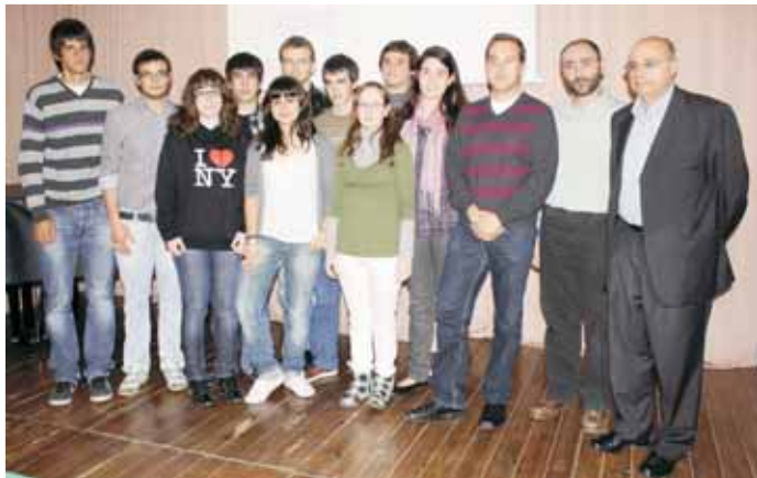
Els participants al Premi Juvenil Vicenç Plantada

El dijous 6 de maig es va fer públic al Centre Cultural La Marineta el veredictes del XI Premi Juvenil Vicenç Plantada, que s'atorga cada any i el de la IX Beca de Recerca Vicenç Plantada, que s'atorga cada dos anys.