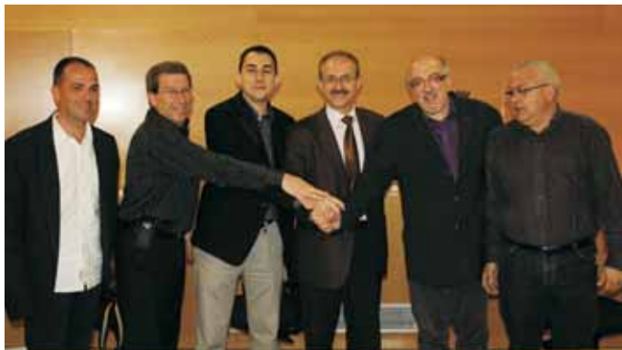
Acord dels sindicats UGT i CCOO amb l'Ajuntament

Es tracta de dos convenis diferents. D'una banda, l'Ajuntament, el sindicat CCOO i el sindicat UGT han renovat l'Acord Local per l'Ocupació i la Cohesió Social, un conveni que ja existia però s'ha adaptat a les noves necessitats del context actual de crisi econòmica. De l'altra banda, l'Ajuntament també ha signat un conveni amb