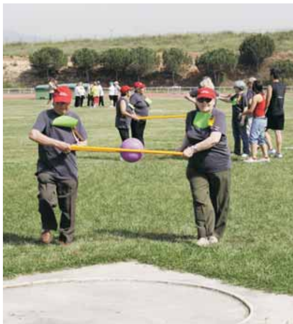
Jornada esportiva per a la gent gran, a les pistes d'atletisme

21 h Cinema a l'aire lliure: La vida en rosa (El Lledoner)