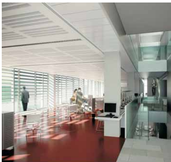
Recreació de l'interior de la futura biblioteca

A banda del nom, ja s'ha donat a conèixer el projecte de l'obra, un espai de més de 3.000 metres quadrats, amb 3 plantes, 46 punts de consulta en línia i 350 punts de lectura.