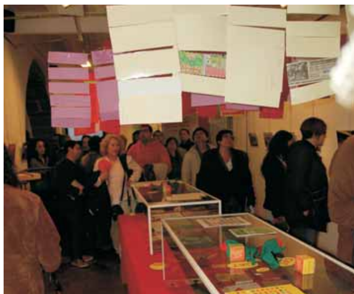
Nombroses persones es van acostar a la inauguració de l'exposició

L'exposició feia un recorregut des de l'any 1987, quan es va inaugurar el Servei de Català a Mollet, fins a l'actualitat, a través de les classes, l'assessorament i la dinamització que s'han fet durant aquests més de 20 anys. L'alumnat hi va participar activament, escrivint frases curtes que es van penjar del sostre amb cartrons, on explicaven què es pot fer si s'aprèn català: "Si aprenc català podré explicar contes al meu fill en català", "podré trobar feina" o "podré ser presidenta de la Generalitat".