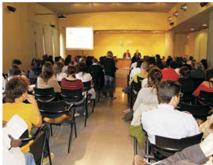
La Jornada de Mediació Escolar es fa des de l'any 2008

Les inscripcions són gratuïtes i ja es poden formalitzar emplenant la butlleta que trobareu a www.molletvalles.cat