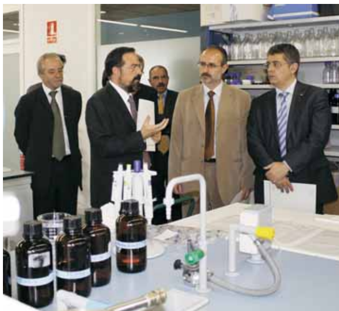
El conseller Llenas a la dreta de la imatge, acompanyat per l'alcalde i el director del GIRO

El conseller d'Agricultura ha destacat la importància dels estudis i els projectes de recerca sobre el tractament de residus orgànics que es desenvolupen al GIRO, no només per a Catalunya, sinó per a tot el món. Per aquest motiu, la voluntat del seu departament és "alleugerir la càrrega que suposa el GIRO per a l'Ajuntament", tot aportant més ajudes de finançament. En aquest sentit, el conseller va lloar la feina que ha fet el consistori molletà, juntament amb l'IRTA, tirant endavant un centre d'aquestes característiques. El conseller es va comprometre a estudiar la fórmula perquè la Generalitat s'impliqui més fermament en el centre.