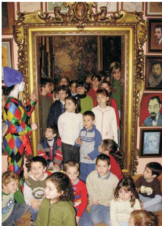
Visita de nens i nenes a la Casa del Pintor

Ser amic o amiga del Museu municipal Joan Abelló és participar en el projecte d'aquesta institució i donar suport a les activitats que organitzen. Poden ser amics o amigues del Museu persones a títol individual, famílies i empreses. Per una mòdica quantitat anual, es tenen una sèrie d'avantatges: entrada gratuïta per al titular del carnet, visita guiada gratuïta programada per a cada exposició temporal, 10% de descompte en les publicacions del Museu, 5% de descompte en la resta de productes promocionals de la botiga i 15% de descompte en les activitats no gratuïtes, com excursions i sortides per visitar museus i exposicions de Catalunya, d'Espanya i de l'estranger.