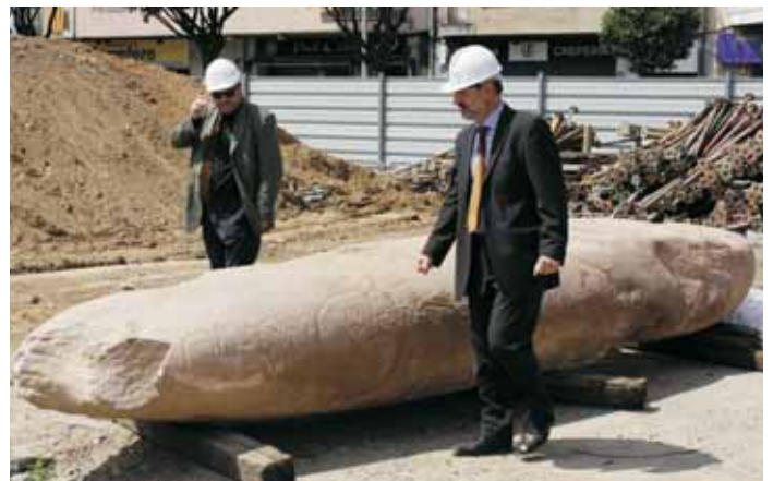
L'alcalde i el subdirector de Patrimoni, al costat del menhir