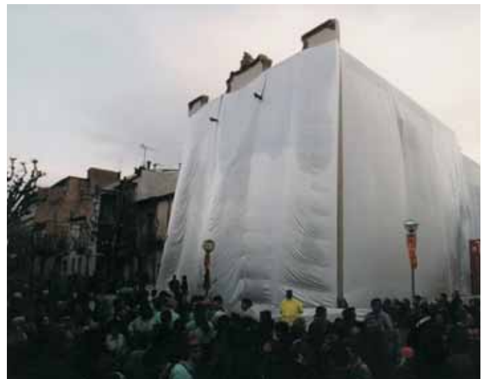
A l'esquerra, l'arribada del mestre Abelló en globus. A la dreta, planta baixa del museu on s'exhibeixen les exposicions temporals. A baix, el Museu Abelló embolicat, a punt d'inaugurar-se, el 29 de març de 1999