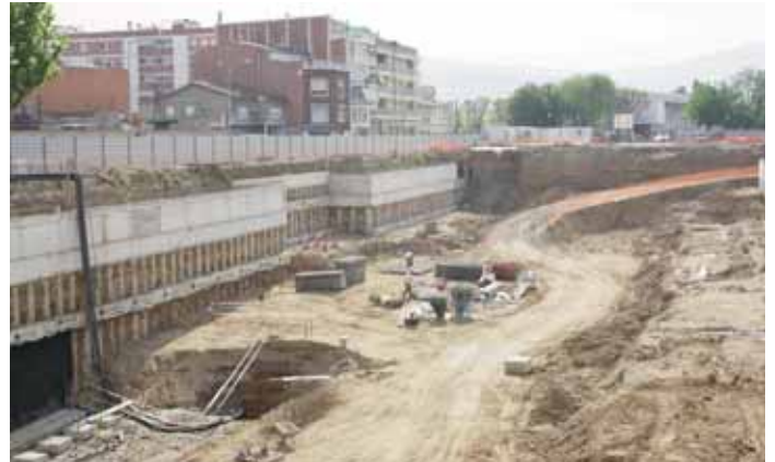
Espai on s'ha trobat el menhir