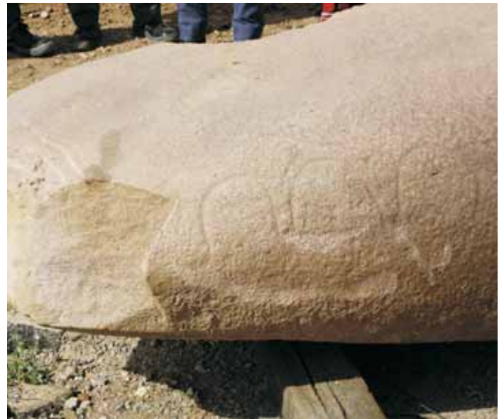
Detall dels gravats que hi ha al menhir

Després del primer ensurt i la posterior il·lusió que va generar la trobada del menhir molletà, s'ha engegat una feina de cabdal