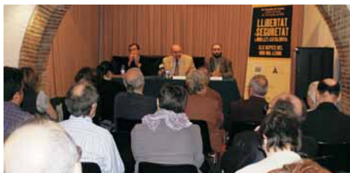
Inauguració de les Jornades del CEM de l'any passat

El Centre d'Estudis Molletans passa al mes de juny les habituals jornades que tradicionalment feia el mes d'octubre. Les jornades es celebraran el 12 i 13 de juny proper, amb el títol Les religions dins de la comunitat molletana: integració i convivència . Coorganitzades també pel Centre d'Estudis per la Democràcia (CED), l'objectiu d'enguany és analitzar com les diferents religions que es practiquen a la nostra ciutat poden ajudar a ser factors d'integració i de convivència. Podreu trobar més informació, properament, al web municipal www.molletvalles.cat .